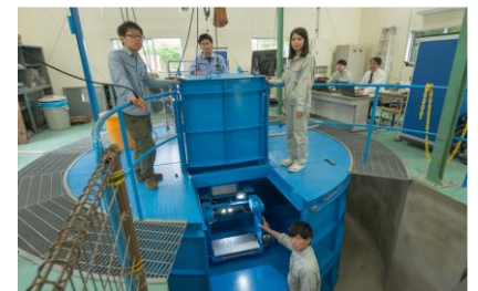
動的遠心力模型実験