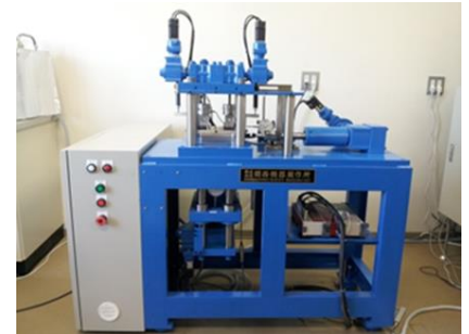
高知高専型 動的一面せん断試験